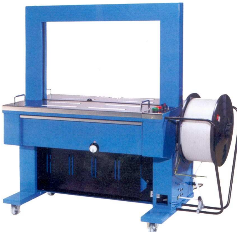
Dimensions de l'arche en mm

Les caractéristiques: fiabilité, rapide, silencieuse simple à utiliser et à entretenir mise en place du feuillard facile livrée avec commande au pied