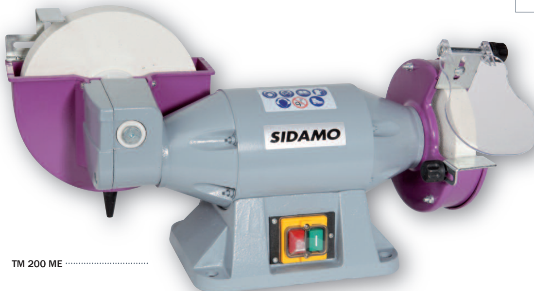
TM 200 ME .....

✓ Conseils d'utilisation : Par mesure de sécurité, nous vous rappelons qu'il est obligatoire de fixer le touret sur un socle ou sur un établi.