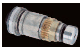
Embrayage assurant la longévité de la machine et safeguardant la fraise scie