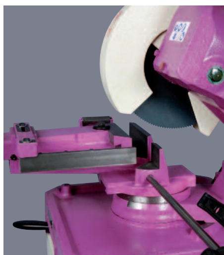
Étau à déplacement avant - arrière pour la finition de gros profilés