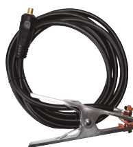
Pince de masse