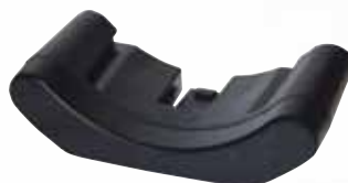
Batterie de rechange Li-ion