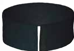
Filtre à charbon lot de 10