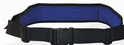
Ceinture de confort