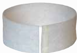
Préfiltre lot de 10

(2) La durée de travail dépend du mode de travail choisi.